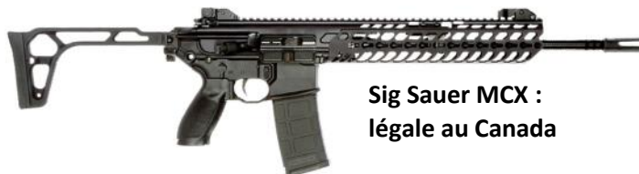
Sig Sauer MCX : légale au Canada

Or, malgré les risques évidents associés aux armes d'assaut, la GRC continue d'approuver de nouveaux modèles pour vente sur le marché canadien malgré la promesse libérale d'éliminer ce type d'armes de nos rues 9 , y compris des versions non restreintes 10 — ce qui veut dire qu'elles ne sont pas enregistrées, que personne ne sait qui en est propriétaire et qu'il n'est pas nécessaire de vérifier la validité du permis de possession de la personne à qui elles sont vendues.