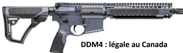
DDM4 : légale au Canada