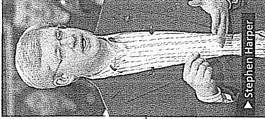
► Stephen Harper